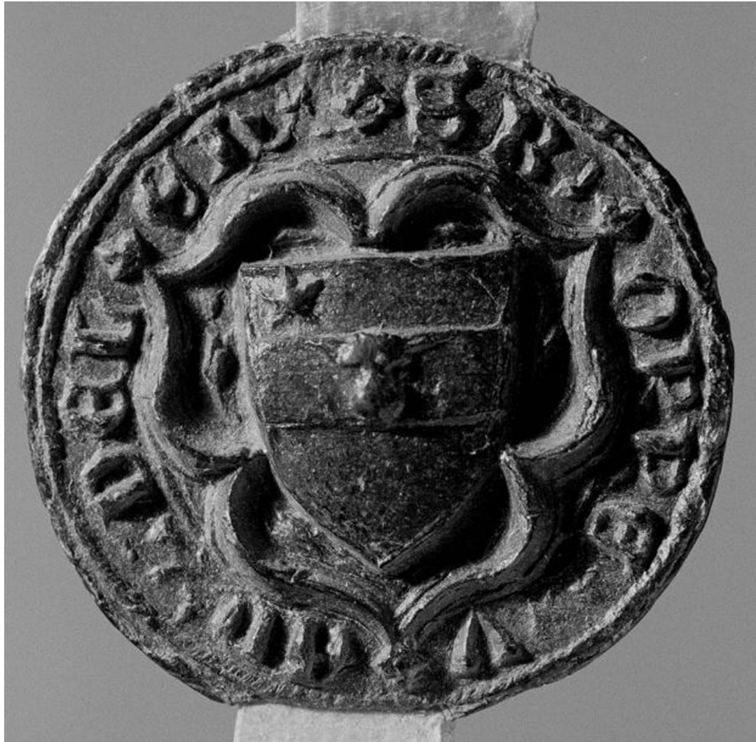
Wapen van Bor van Delen