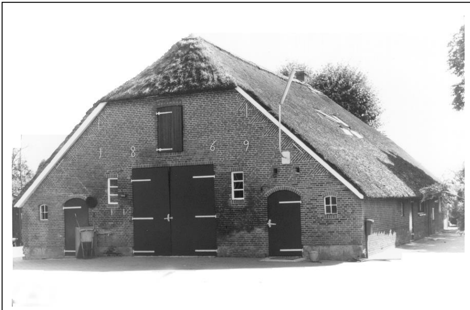
Achterhuis van boerderij "De Folmert" in Wekerom.