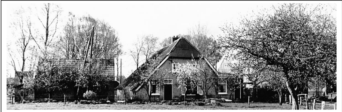
Boerderij "De Wesselsche Hoef" onder Barneveld.

Wekerom. In het jaar 1872 wordt boerderij "De Folmert" verkocht en verhuist Gijsbert met zijn vrouw en vijf kinderen naar boerderij "De Wesselsche Hoef" onder Barneveld. In Barneveld wordt het zesde en laatste kind geboren.